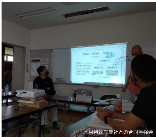
木村特殊工業社との合同勉強会